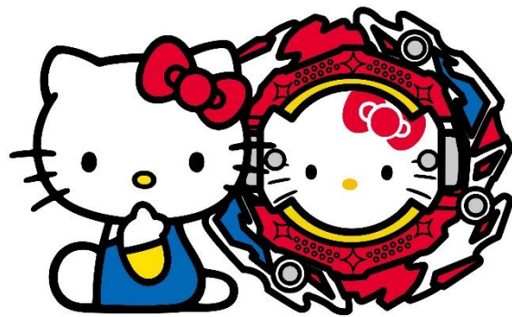
イメージイラスト

株式会社タカラトミー(代表取締役社長：小島一洋/所在地：東京都葛飾区)は、現代版ベゴマ『ベイブレード』の最新シリーズである「ベイブレードバースト」より、株式会社サンリオのキャラクターである「ハローキティ」デザインのベイブレード「 B-00 ブースター アストラル ハローキティ.Ov.R'-0 」を、2022年9月17日（土）から全国の玩具専門店、百貨店・量販店の玩具売場、インターネットショップ、タカラトミー公式ショッピングサイト「タカラトミーモール」( takaratomy.com )等にて発売します。