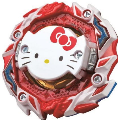
「B-00 ブースター アストラル ハローキティ.Ov.R'-0」